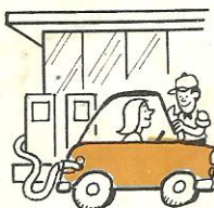
a la estación de gasolina